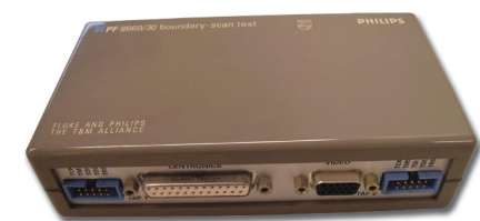
Рис. 3. Один из первых контроллеров периферийного сканирования, находящийся в музее JTAG Technologies в г. Эйнховен (Нидерланды)

не имея «живого» образца. Как уже было упомянуто выше, системе периферийного сканирования нужна только схематика платы для разработки тестов и приложений. В дополнение к схематике требуется ввести информацию об используемых компонентах (в особенности тех, которые поддерживают периферийное сканирование). После этого система анализирует межкомпонентные связи и логику самих компонентов для генерации всевозможных тестов. Во время генерации также создается отчет о тестовом покрытии платы — теоретическом и реально достигнутом. Система проектирования JTAG ProVision позволяет даже визуализировать отчет на схематике и, при наличии файлов разводки, на рисунке печатной платы. На рисунках 1 и 2 показано табличное представление расчета тестового покрытия платы и его визуализация на печатной плате.